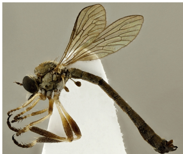
Obr. 1. Leptogaster pubicornis , samec, Káraný, 6.VII.2017.

ny abecedně (PRUNER & MÍKA 1996). V práci jsou použity zkratky: coll. – sbírka, det. – determinoval, leg. – sbíral, NP – národní park, NPP – národní přírodní památka, NPR – národní přírodní rezervace, PP – přírodní památka, PR – přírodní rezervace, bor. – severní, centr. – střední, mer. – jižní, occ. – západní, okr. – okres.