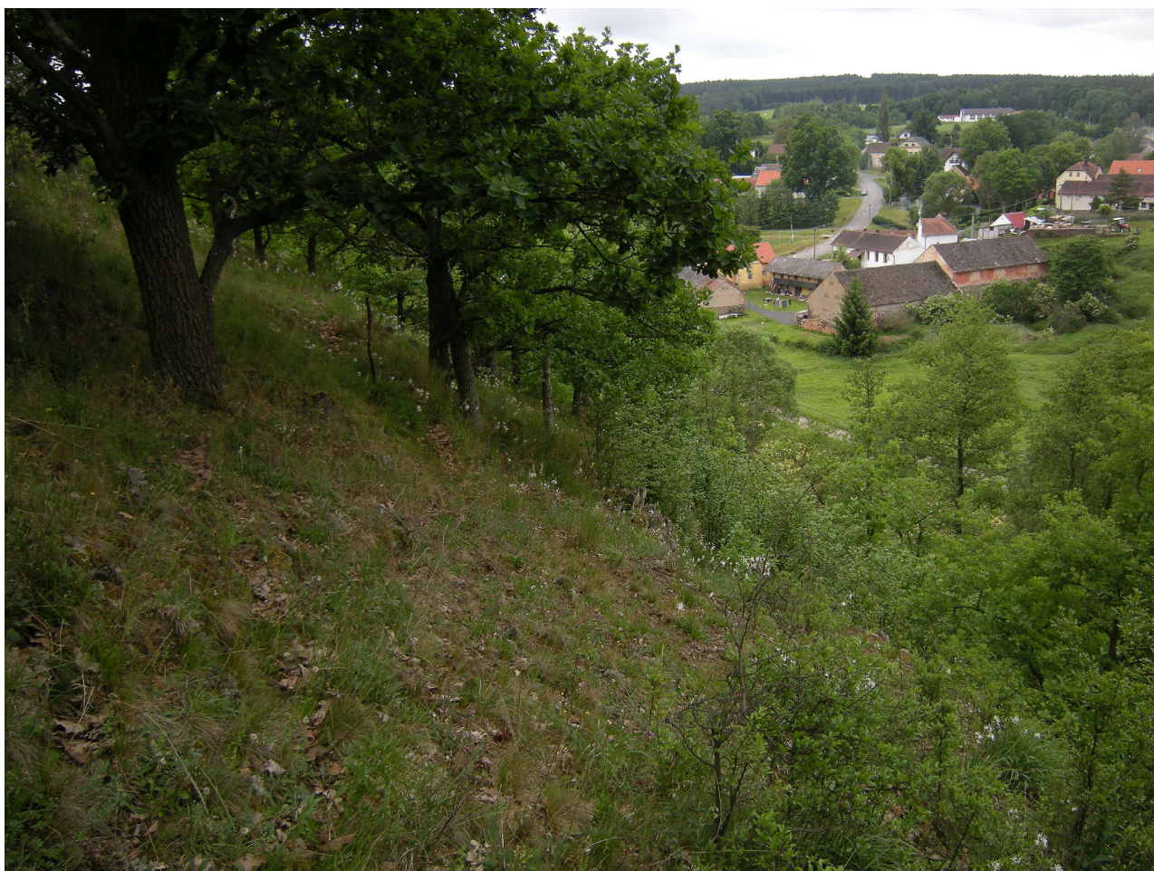
Obr. 4. Lokalita Milíkov – biotop Leptogaster subtilis . Fig. 4. Locality Milíkov – habitat of Leptogaster subtilis .

3 ♀♀, 20.VII.2017, 1 ♂; vše P. Marhoul leg., det. et coll.; Hodonín (7168), PP Pánov, 48°53'9.841"N 17°8'10.091"E, 200 m n. m., 11.VI.2017, 2 ♀♀; Slup (7262), PP Ječmeniště, 48°44'45.615"N 16°8'54.569"E, 250 m n. m., 3.VII.2018, 1 ♂, vše P. Marhoul leg., det. et coll.; Mikulov (7266), pís-kovna Mušlov, 48°47'28.790"N 16°40'46.448"E, 200 m n. m., 2.VII.2018, 1 ♂, R. Vlk leg., P. Marhoul det. et coll.