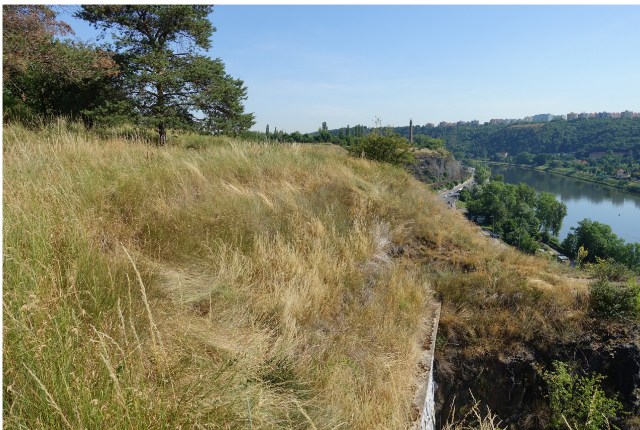
Obr. 2. Lokalita PP Baba, Praha – biotop Leptogaster pubicornis .