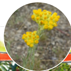
smil písčný 3

Vůbec nevádí, pokud všechny zdejší druhy neznáte. Stačí se pozorně dívat kolem sebe, poslouchat, všimnout si zvuků a barev. Některé určitě poznáte na první pohled podle obrázku. Na jiné budete potřebovat více času a zkušeností. Určitě ale vždy objevíte něco nového.