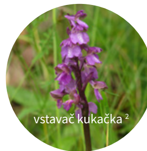
vstavač kukačka 2

Za pozornost stojí také zdejší jedinečná příroda. Už v časném jaře rozkvetou na Havranickém vřesovišti stovky konikleců velkokvětých. V květnu a červnu můžete na Mašovické střelnici obdivovat dvě z našich orchidей: prstnatec bezový a vstavač kukačku. Budete-li mít štěstí, můžete zde najít také jasně červený