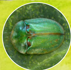
štítonoš 4 Cassida prasina