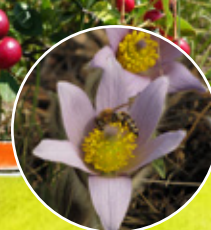
koniklec velkokvětý 8