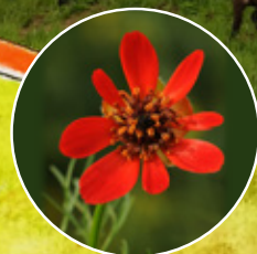
hlaváček plamenný 6