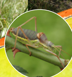
kobylka révová 9