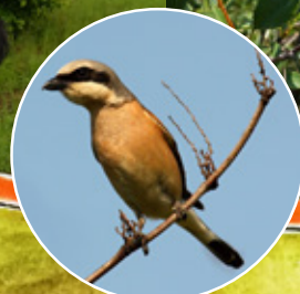
tuhýk obecný 7