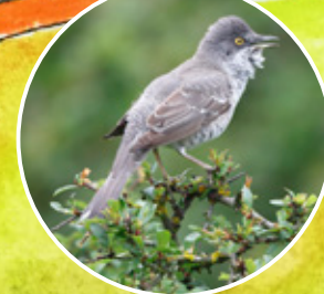
pěníce vlašská 10